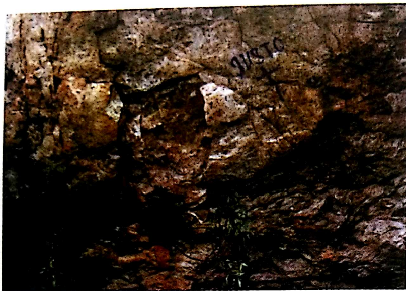
Garganta del Muerto (Solana del Pino). En esta imagen se pueden apreciar las agresiones que han sufrido estas pinturas: extracción del panel de pinturas y grafito con pintura plástica.