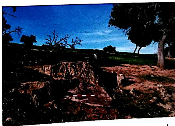
Cerro Canitos (Solana del Pino). Roca con grabados rupestres.