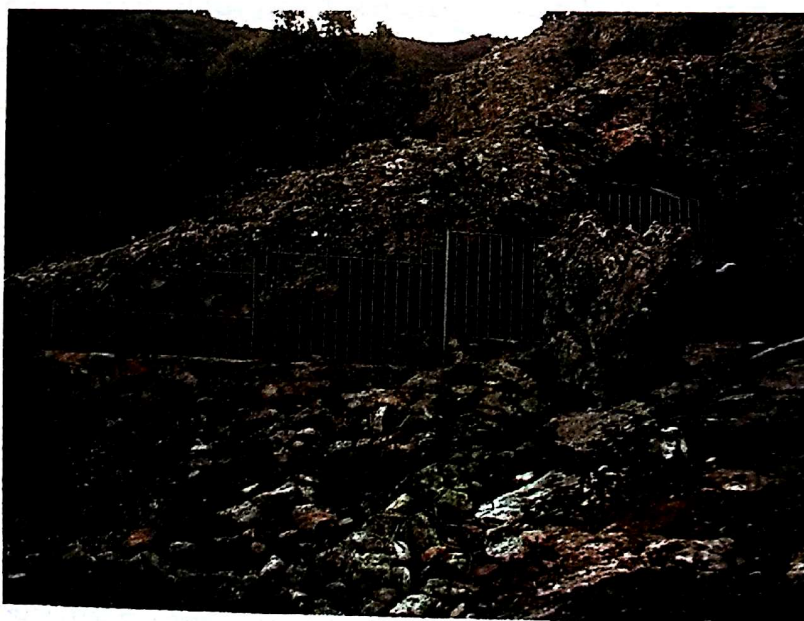
Vallado de la Cueva de las Serpes (Fuencaliente).

Además, este sistema de cerramiento debe coordinarse con algún tipo de guardería que controle la entrada "ilegal" de personas al interior del recinto vallado. Todo ello supone unas cargas adicionales en gastos de personal, que la mayoría de los Ayuntamientos de la mancomunidad del Valle de Alcudia y Sierra Madrona, por el momento, no pueden hacer frente.