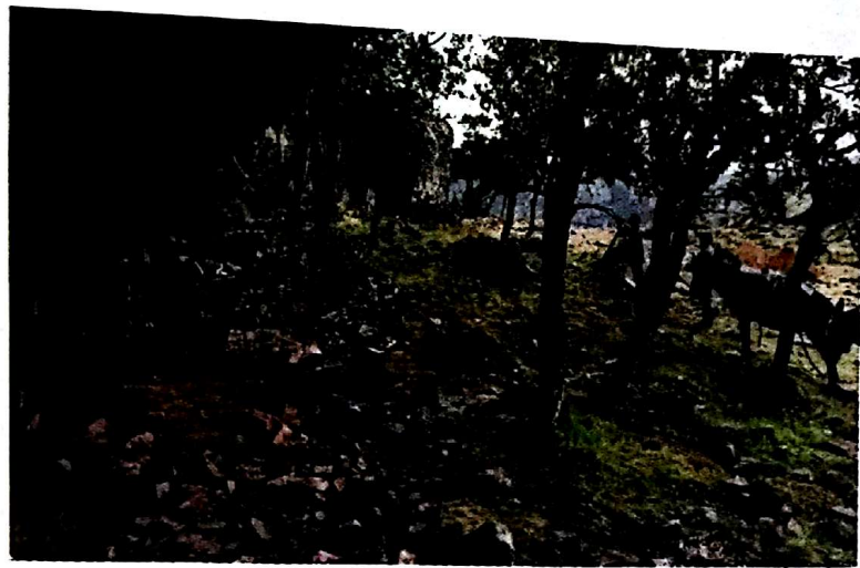
Sondeos arqueológicos y levantamiento topográfico en el abrigo de el Morrón de el Pino (Fuencaliente).

Como paso previo a la protección de las pinturas, y en cumplimiento de la Ley del Patrimonio Histórico Español y la Ley del Patrimonio Histórico de Castilla-La Mancha ha sido necesario realizar intervenciones arqueológicas de urgencia en cada uno de los yacimientos seleccionados para su puesta en valor.