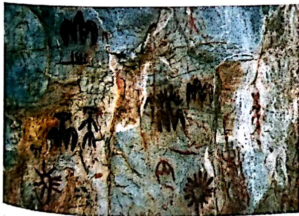
Peña Escrita (Fuencaliente). Detalle de las pinturas.

Como complemento a los datos recogidos en la ficha se ha llevado a cabo una exhaustiva documentación fotográfica de cada uno de los lugares y su entorno inmediato.